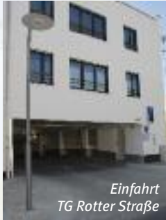
Einfahrt TG Rotter Straße

Rund 850 Parkplätze bietet alleine die Grafinger Innenstadt. Ganz neu und ganz nah zum Marktplatz sind die 54 Tiefgaragenplätze in der Rotter Straße 12. Hier kann drei Stunden kostenfrei geparkt werden.