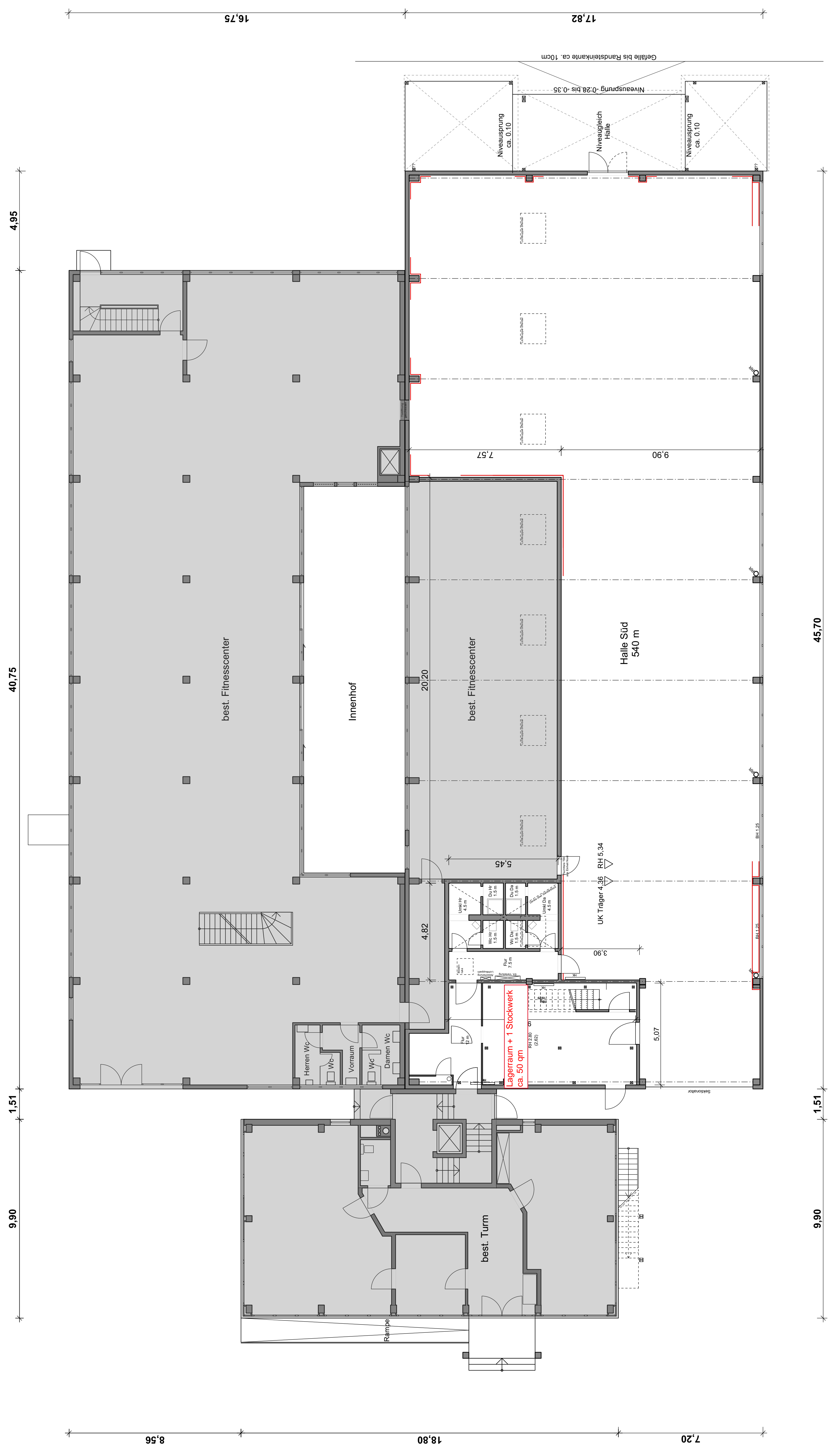
ERDGESCHOSS M 1/100

ZUSAMMENFÜHRUNG UNTERSCHIEDLICHER PLANSTÄNDE ALS BESTANDSGRUNDLAGE => NUR BEDINGT ZUR MAßENTNAHME GEEIGNET! SÄMTLICHE MAßE SIND VOR AUSFÜHRUNG EINGENVERANTWORTLICH ZU ÜBERPFRÜFEN!